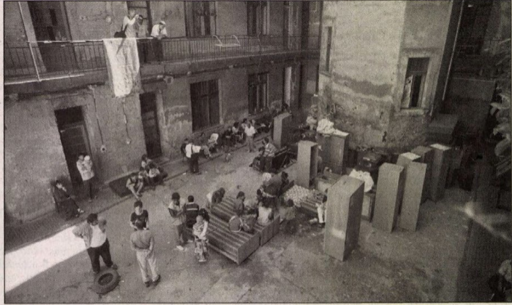
Kilakoltatás a Várna utcában